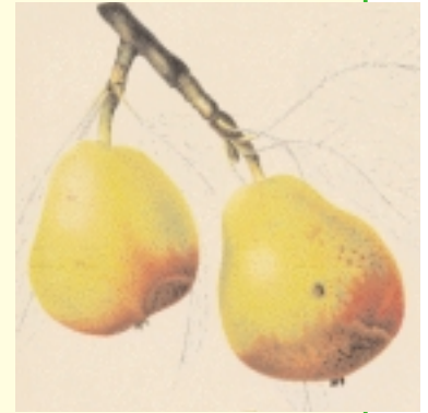
'Nina' (aus: Pomologische Monatshefte Nr. 2, 1884)

Besondere Merkmale: bei nahezu allen Früchten starke zimtfarbene Berostung im Kelchbereich und oft bis zur Mitte der Frucht. Schmales, auf der Unterseite wolliges Blatt.