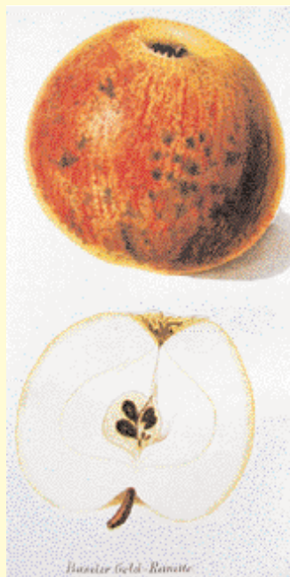
Bildquelle: Illustrierte Monatshefte 1872, S. 308-309 Fotos: Markus Zehnder

Karl Rebmann aus Pratteln bei Basel beschrieb diese Sorte vor 130 Jahren, aber schon damals wurde sie bereits seit vielen Jahren vermehrt und war unter den älteren Obst-