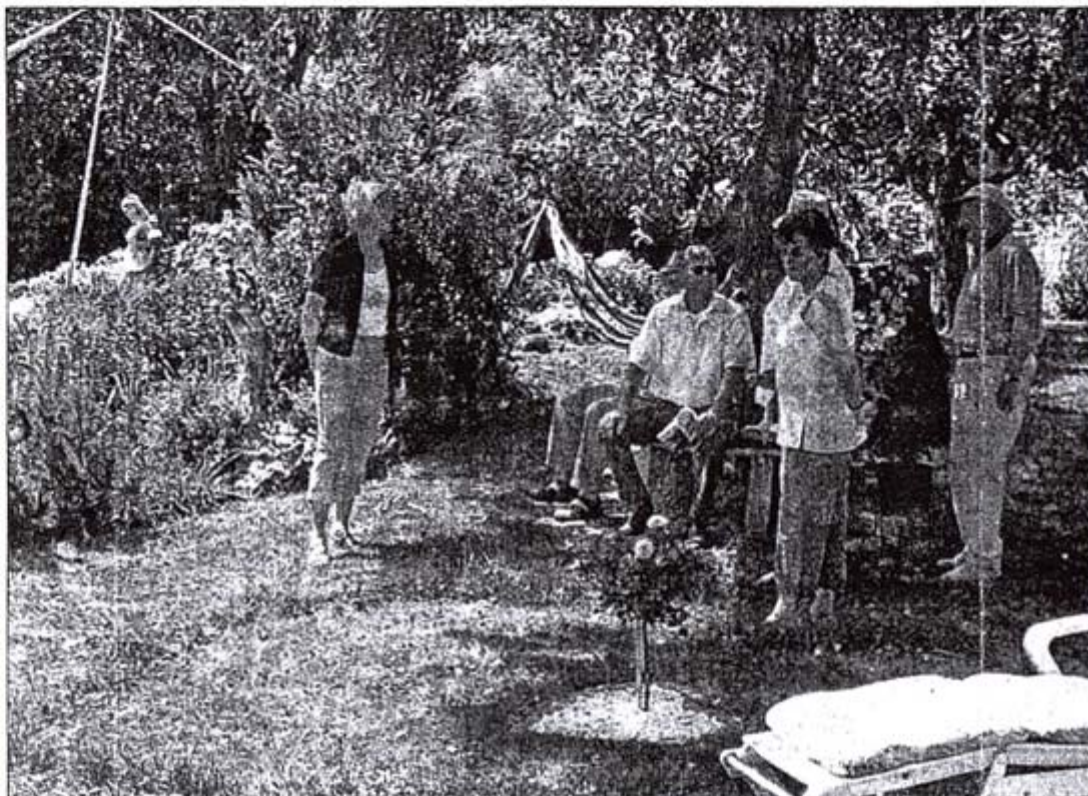
Zehn offene Gärten haben am Wochenende in Spaichingen viele Besucher angelockt.

Den ganzen Tag über war bei der Marienkapelle ein Kommen und Gehen, wobei der OGV auch für eine Bewirtung sorgte.