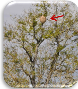
Nest der Asiatischen Hornisse