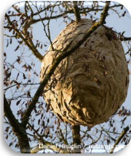
Nest der Asiatischen Hornisse